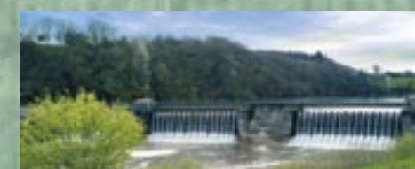
L'histoire du barrage

Le barrage a été construit entre 1975 et 1978 sur la commune de Saint-Fraimbault-de-Prières. Son objectif était de soutenir le faible débit périodique de « la Mayenne » afin de satisfaire les besoins d'alimentation en eau potable. Des 1969, la direction départementale de l'agriculture procédait aux premières études d'implantation du barrage. Le site se justifiait, à cette époque, par la présence d'un versant très relevé sur la rive droite et d'un éperon rocheux sur la rive gauche. Le 15 mai 1972, le Conseil général de la Mayenne décidait de la construction du barrage. En 1984 était créée une centrale hydroélectrique. La longueur du barrage est de 210 m et sa hauteur maximum de 15,5 m (y compris les fondations). La superficie du plan d'eau ainsi créé est de 123 ha représentant un volume d'eau de 3,2 millions de m 3 .